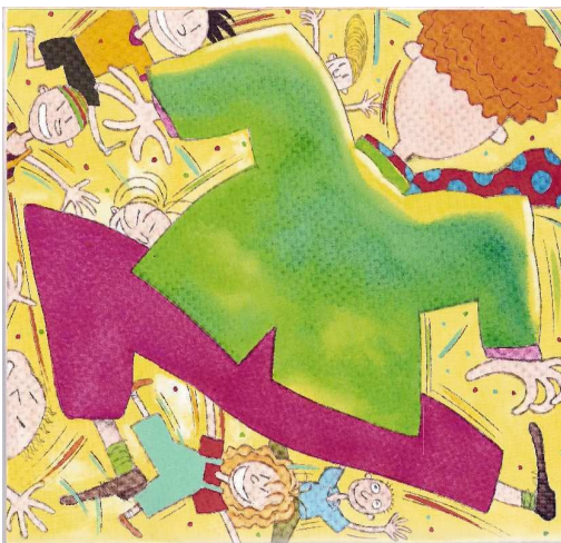
Figura 9: Páginas Ilustradas in: “O louco do meu bairro”