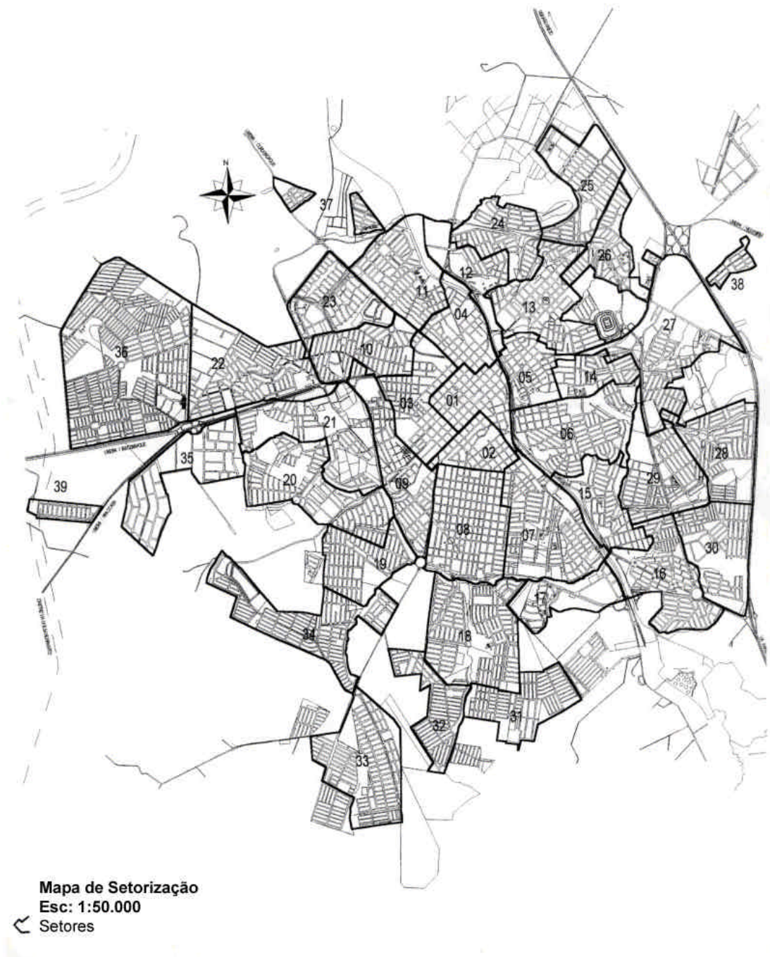
Figura 28: Mapas de setorização do município de Limeira

Fonte: PREFEITURA MUNICIPAL DE LIMEIRA, 1989b.